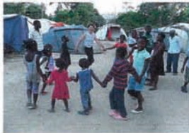
à Pandiassou : village de sinistrés de Port au Prince