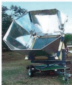
1 FOUR SOLAIRE +1 FOUR ELECTRIQUE