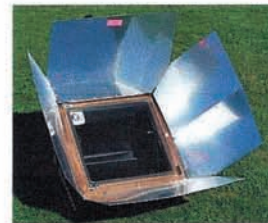
5 FOURS SOLAIRES POUR FAMILLES