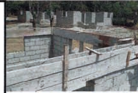
grâce aux dons reçus 2 maisons "en dur" offertes à des réfugiés

en mars 2011 Colette et Norbert se sont rendus à Pandiassou - Haïti pour y travailler ( dispensaire-école- et formation informatique )